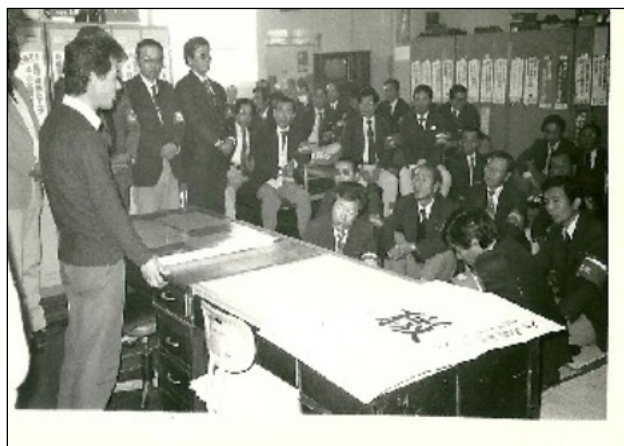
85春闘 金町支部激励集会