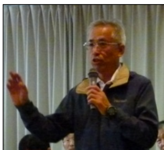
【八王子中央支 部・谷合中央委 員】

宇佐見支部長のもと職場政策を実施し ており、入所者数がプラスになってお り、職場政策が間違っていなかったとあ らためて感じています。今後も組合の 行事にも積極的に参加し、労働運動を 盛り上げていきたいと思っています。