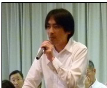
【王子支部 ・上地中央委員】