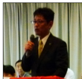
【八王子中央支部 ・山中中央委員】

昨日、「戦争法案」が可決したが、今後、私たち労働者が戦争に荷担させられる事も懸念している。