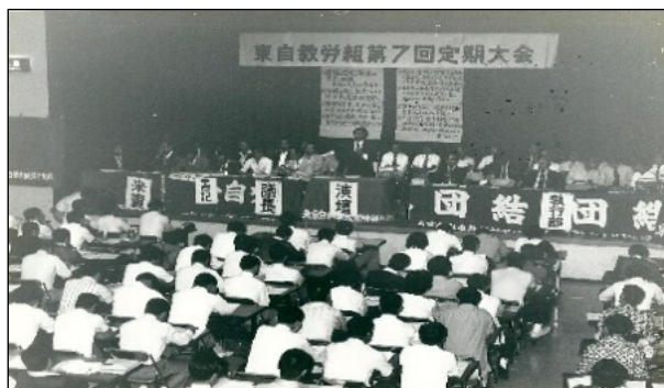
東自教労組第7回定期大会 78年9月