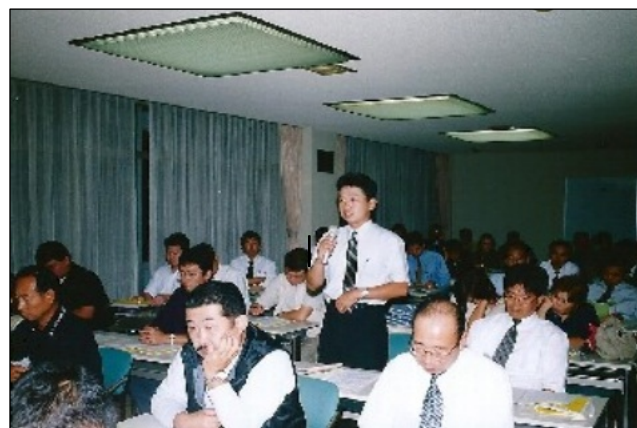
第30回定期大会 01年9月 八王子中央支部大会発言