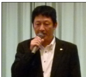
【流山支部 ・香取中央委員】

流山支部の現状を報告したいと思います。組合員の「不当処分問題」は、4月2日に千葉県労働委員会で和解が成立し、現在、教務課に復帰し教習業務を行っています。